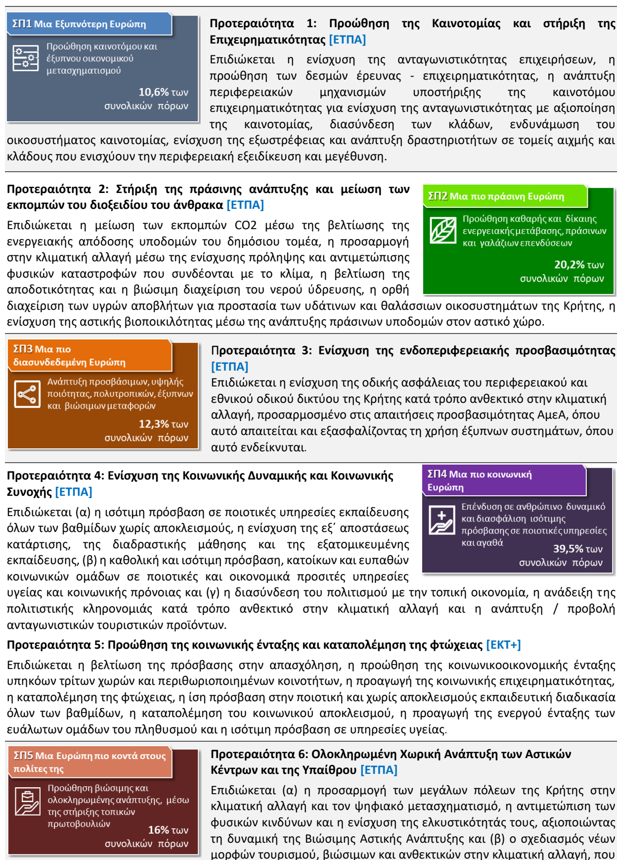
Πίνακας 1: Αντιστοίχιση Στόχων Πολιτικής με Προτεραιότητες του Προγράμματος Κρήτη και τις επιδιώξεις τους