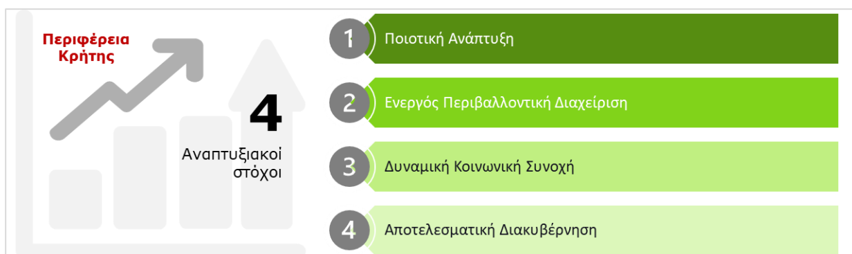
Σχήμα 1: Αναπτυξιακοί Στόχοι Προγράμματος “Κρήτη” 2021-2027

Παράλληλα, το Πρόγραμμα “Κρήτη” στο πλαίσιο σχεδιασμού των παρεμβάσεων του ΕΣΠΑ 2021-2027: